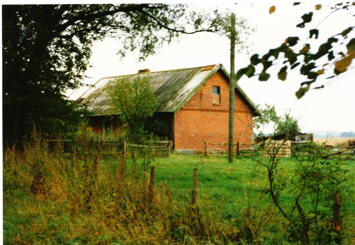
Aufnahme 4/35 vom 21.09.1991: Rüttelsdorf (Neu Pillkallen). Das Stallgebäude von Lokau, links der Chaussee. Hinter Lokau und Gelies hörte Rüttelsdorf auf. Dann kam schon Groß Skirlack.